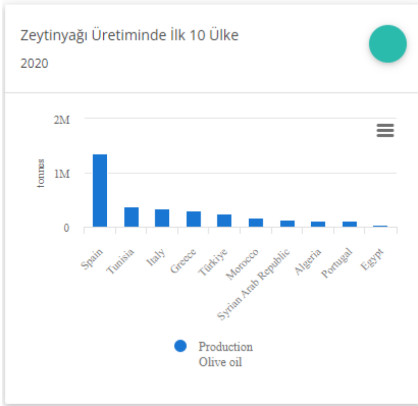
Tablo 1. Dünya Zeytinyağı Üretiminde İlk 10 Ülke

Zeytinyağından sağlık, güzellik, aydınlatma ve beslenme amaçlı olarak faydalanılmıştır. Aynı zamanda merhem ve güzel kokulu yağ olarak kabul edilmiştir. İyileştirici ve rahatlatıcı etkisi olan, güzel kokulu merhemler ve yağlar Anadolu, Levant Bölgesi( bugünkü İsrail, Filistin, Suriye ve Irak'ın bir kısmını içine alan bölge) ve Yunanistan'da yaşamış toplumlarda önemli bir yere sahip olmuştur. (Başoğlu, 2015:1)